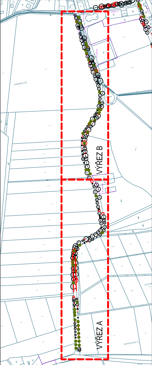
CELKOVÉ SCHÉMA LOKALITY

pozn. U stromů s inv. č. 80 nejsou navržena žádná péstební opatření. Ostatní ponechané stromy jsou navrženy k ošetření. Detailní popis péstebních opatření je uveden v inventarizačních tabulkách (viz. část dokumentace: B - Rozpočet, výkaz výměr). Jakákoli změna při realizaci musí být konzultována s autorem PD.